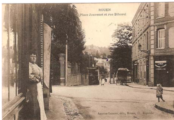
La place Jouvenet à un siècle d'intervalle